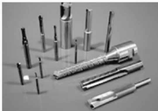
Dụng cụ xoay PCD&PCBN