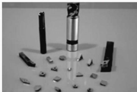
Đầu hạt dao PCD&PCBN