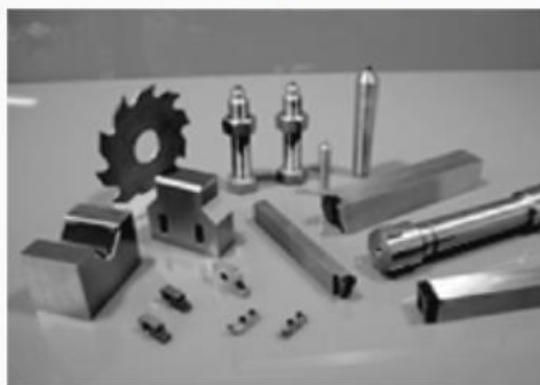
Sản phẩm đặc biệt PCD&PCBN